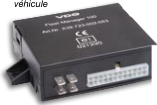
FM 100 dans le véhicule